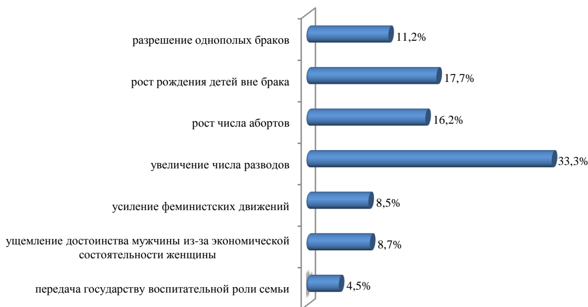
Рис. 2. Причины деградации института семьи

Еще одной актуальной проблемой современного общества, которая угрожает институту семьи, является разрешение однополых браков, 11,2 % опрошенных считает ее значимой причиной деградации.