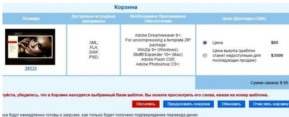
Рис. 4. Стоимость шаблона

Многие считают, что шаблонный дизайн – это плохо, что сайты будут похожи один на другой. Но это не совсем так. Ведь дизайн – это не код. Используя один и тот же дизайн, можно воплотить в жизнь различные функциональные возможности. Например, сделать выпадающее меню, красивую анимацию и много другое. К тому же, иногда необходимость уникального дизайна просто отсутствует. Например, когда создается внутрисетевой портал, не имеющий выхода в интернет. Да и к тому же, шаблонный дизайн на порядок дешевле.