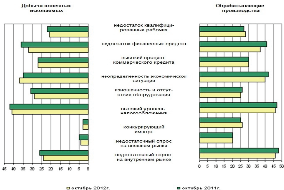
Рис. 1. Оценка факторов, ограничивающих рост производства 1 , в % от числа опрошенных

Поскольку организации вынуждены адаптироваться к изменяющимся внешним условиям, им приходится модифицировать цели и параметры функционирования [3]. Эти изменения могут носить революционный характер, т. к. охватывают все виды деятельности. Переход от одного состояния к другому предполагает как минимум фиксацию этих состояний. Оценка текущего состояния традиционно выполняется на основе анализа, а будущее состояние определяется путем прогнозирования (в краткосрочной и долгосрочной перспективе).