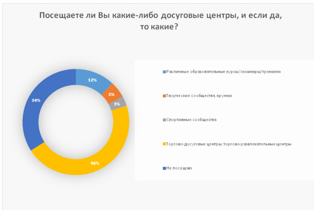
Рис. 1. Ответы респондентов на вопрос: «Посещаете ли Вы какие-либо досуговые центры, и если да, то какие?», %

Также, стоит обратить внимание, что почти четверть респондентов выразила желание проводить досуг в путешествиях. Несмотря на то, что спортивные центры посещает крайне малое количество опрошенных (3%), активный отдых в виде путешествий привлекает почти в восемь раз большее количество людей, чем спортивные секции, что выявляет новый путь социально-экономической интеграции людей «третьего возраста» посредством: туризма, как внутреннего, так внешнего. Одной из наиболее актуальных проблем являются проблемы бытового и экономического плана (рис. 3).