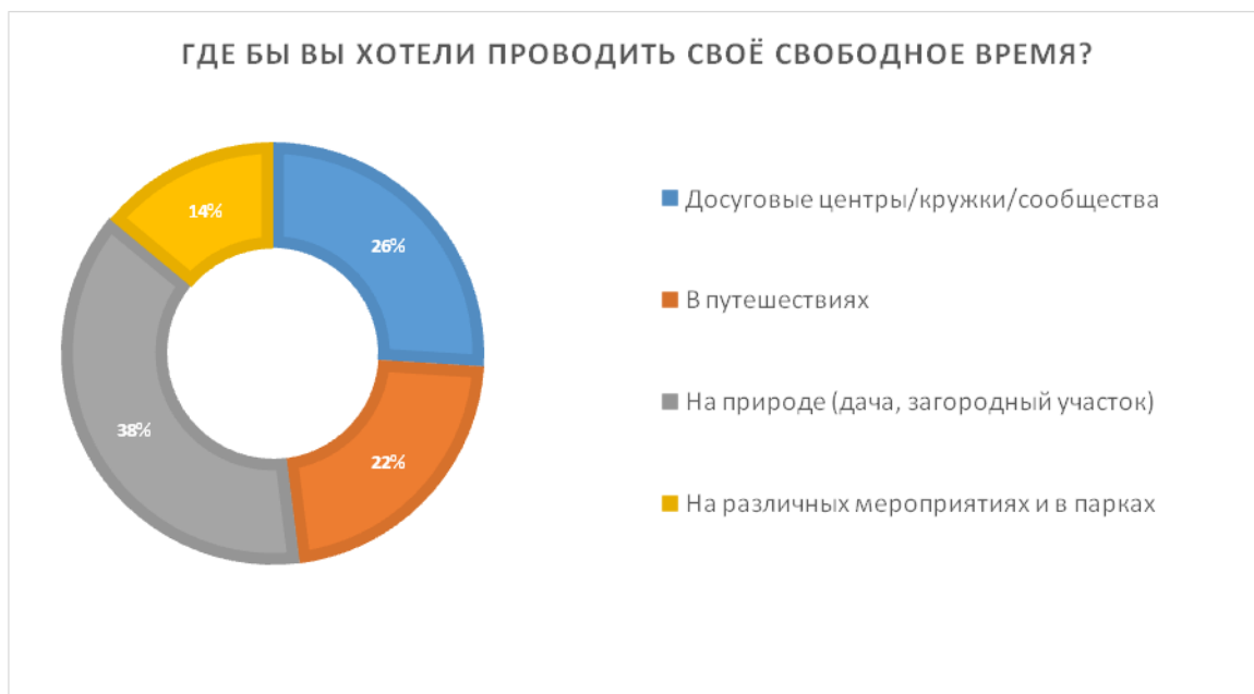
Рис. 2. Ответы респондентов на вопрос: «Где бы Вы хотели проводить свое свободное время?»