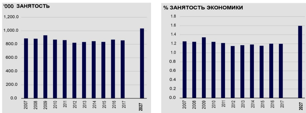
Рис. 2. Вклад туризма в занятость населения