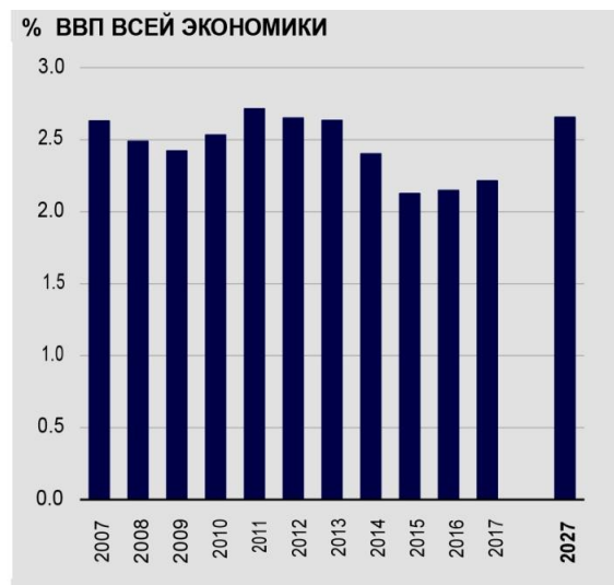
Рис. 3. Капитальные вложения в туризм РФ

– уровень безработицы начал расти в начале 2016 г., так как многие компании частного сектора и государственные органы начали инициировать массовые увольнения;