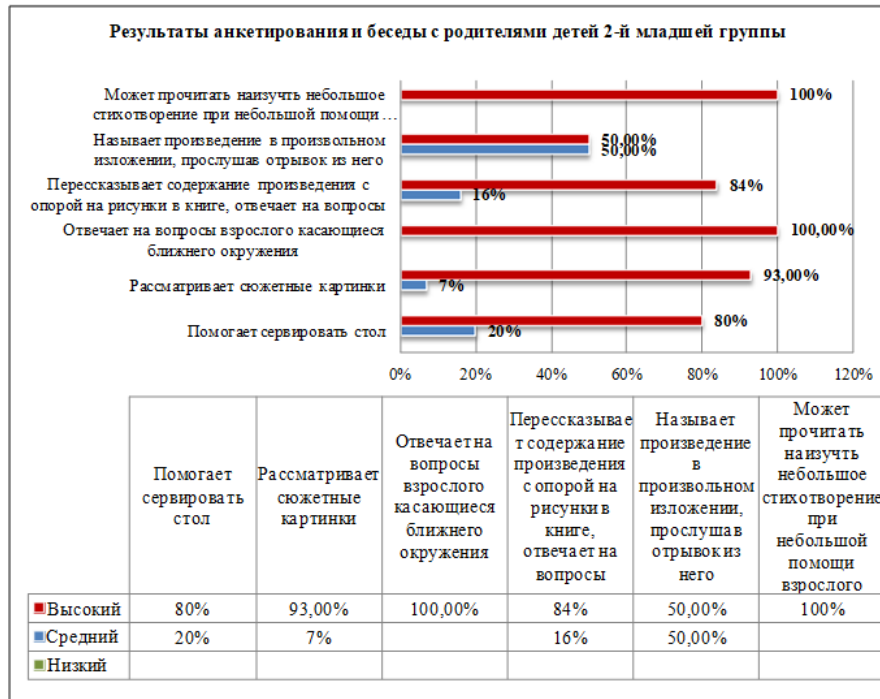
Рис. 3. Результаты анкетирования и беседы с родителями воспитанников об уровне социально-коммуникативного развития детей второй младшей группы

коммуникации. Затем по тем же показателем произведена оценка специалистами дошкольного учреждения. Результаты представлены на рис. 3–6.