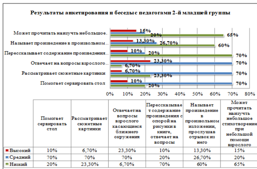
Рис. 4. Результаты анкетирования и беседы с педагогами об уровне социально-коммуникативного развития детей второй младшей группы