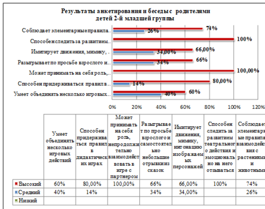
Рис. 5. Результаты анкетирования родителей воспитанников об уровне социально-коммуникативного развития детей второй младшей группы Fig. 5. Results of the questionnaire of parents of pupils on the level of social and communicative development of children of the 2nd junior group