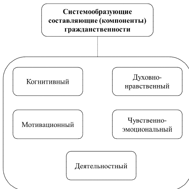
Рис. 1. Компоненты гражданственности личности студента Fig. 1. Components of student's civic consciousness

В условиях педагогической деятельности важно понимать, что гражданственность личности следует рассматривать как интегративное, системно-комплексное качество, в основе которого находятся вышерассмотренные компоненты. В связи с этим, обращаясь к затронутому в начале статьи психолого-аналитическому контексту модели, актуализируем представления о личности современным значением модели гражданского воспитания.