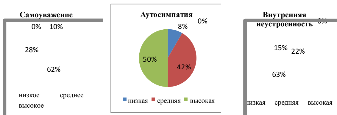
Рис. 1. Анализ результатов по методике МИС (данные по I группе)

одинаковом количестве, есть дети с низким уровнем самоуважения и негативным эмоциональным отношением к себе, психологической неустойчивостью и дезадаптацией. Эти подростки не обладают эффективными способами саморегуляции и адекватной самооценкой, у них возможны проявления агрессии и аутоагрессии, зависимого и асоциального поведения. Эта группа детей нуждается в психологической помощи и коррекции самоотношения.