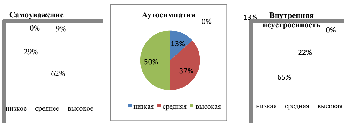
Рис. 2. Анализ результатов по методике МИС (данные по II группе)

Следующим этапом нашей работы являлось изучение самооценки с помощью процедуры ранжирования. По результатам данной методики, мы провели сравнительный анализ (в процентном соотношении). Как видно из рисунка 3, уровень самооценки подростков при сравнении двух групп значительно различается. Самооценка испытуемых второй группы почти в два раза ниже, чем в первой. Данное различие необходимо проверить с помощью процедур сравнительного анализа, является ли оно достоверным и статистически значимым. Но уже по результатам данной ме-