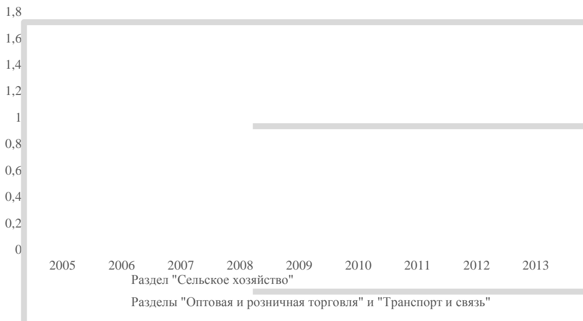
Рис. 2. Динамика интегрального коэффициента локализации по разделу «Сельское хозяйство» и совокупности разделов «Оптовая и розничная торговля» и «Транспорт и связь» ОКВЭД (составлено по данным [2])

выше 1, что дает право говорить о возможности реализовать потенциальный кластер на базе данного вида экономической деятельности.